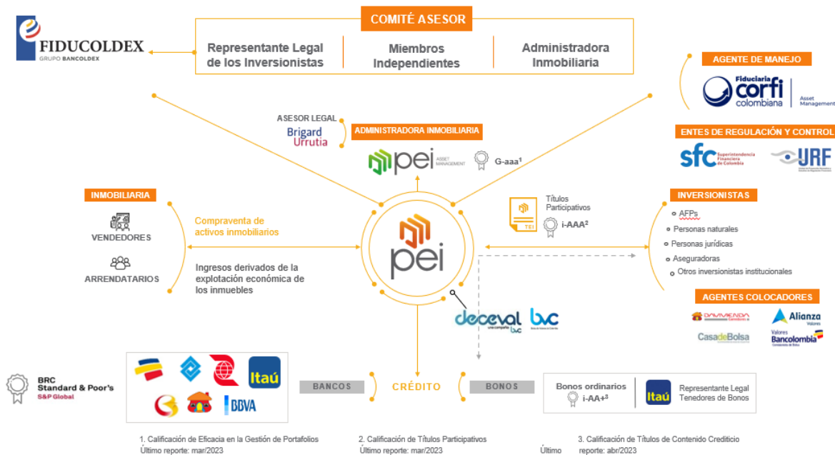
Gráfico 3 Esquema de la titularización

Con la titularidad de los bienes, el patrimonio autónomo recibe como principal ingreso las rentas de las mencionadas propiedades, las cuales se convertirán, luego de cancelar todos los costos y gastos de emisión, administración y operación, en la parte principal de los rendimientos distribuibles que, a su vez, junto con la valorización o la desvalorización de los activos, determinarán la rentabilidad de los inversionistas.